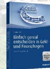
Hartmut Walz „Einfach genial entscheiden in Geld- und Finanzfragen“

Beide Bücher sind am Vortragsabend erhältlich.