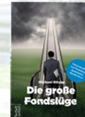
Michael Ritzau „Die große Fondslüge“